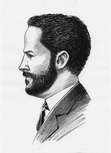
A. ジェラルド自画像復元スケッチ